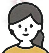
公務員速成科 Oさん (福岡大学卒)